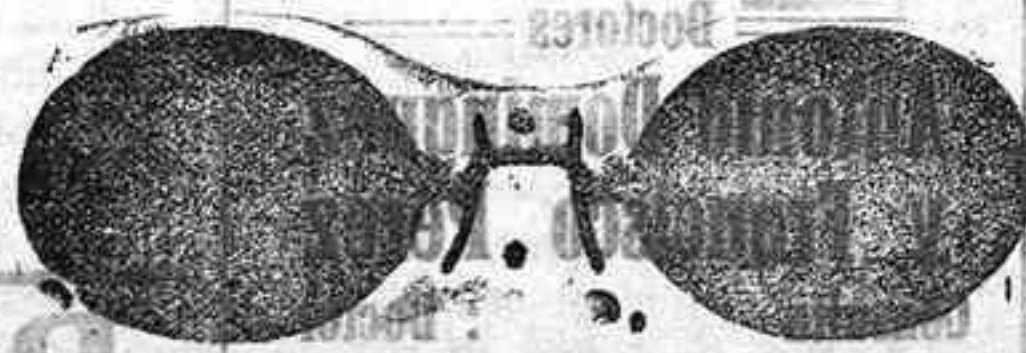
Este modelo, en níquel, 5 pesetas.

Inmenso surtido en toda clase de Gafas o Lentes, en oro, oro chapeado, níquel y concha; GAFAS O LENTE, oro chapeado, clase garantizada, con cristales graduados, a 12 pesetas; en níquel, 5. ESTUCHE-PIEL, AMERICANO, 1,25 en relación de precio son los restantes.