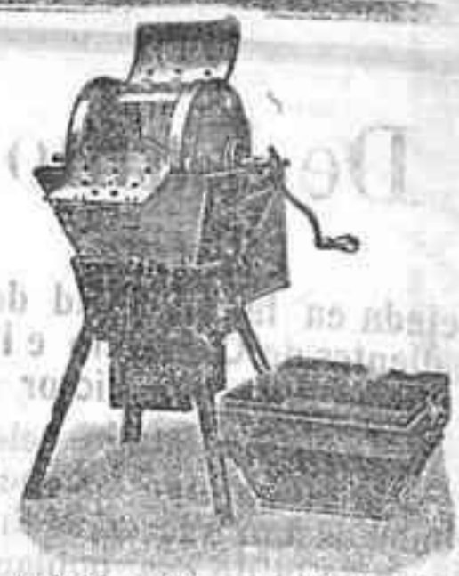
Máquina de lavar Todo Va

Para todo: desde la familia más reducida hasta los más grandes establecimientos