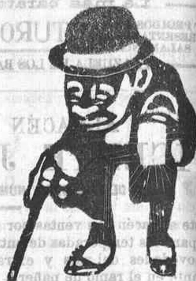
¿Busca usted trabajos cómodos, confeccionados esmeradamente y con economía?

La primera descripción que, juntamente con un dibujo, envió el descubridor á Inglaterra, fué considerada como una fábula; pero pronto se pudo enviar un ejemplar de la planta misma.