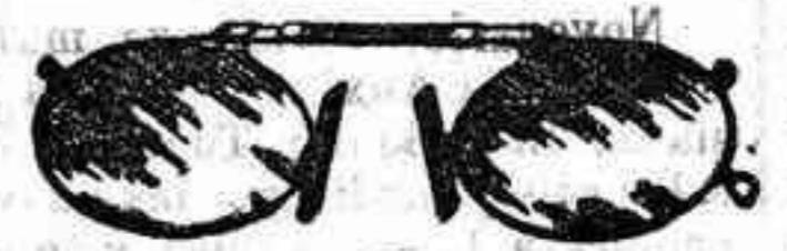
Lentes o Gatas de CRISTAL ROCA, 5 Pesetas.