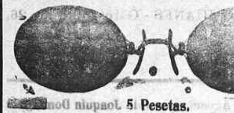
Modelo número 5. Pesetas.

Gemelos prismáticos y directos para campo y teatro, barómetros, termómetros y brújulas. LENTES Y GAFAS chapadas oro, con factura de garantía, y cristales graduados, 12 pesetas; en níquel, 5 pesetas; gafas o lentes ahumadas, a una peseta; asegurando a todo cliente una economía del 80 por 100, no siendo así me haría cargo del genero. Si desprecian recetas de los señores oculistas. Única casa en la región que construye toda clase de ruedas dentadas para relojes, gramófonos, contadores y aparatos mecánicos. La casa que más relojes de torre ha puesto en la provincia; todos los que quieren hacer instalación de estos relojes, pueden pedir precios y presupuestos, que dará gratis, viendo una economía del 80 por 100. Sólo esta casa puede hacerlo.