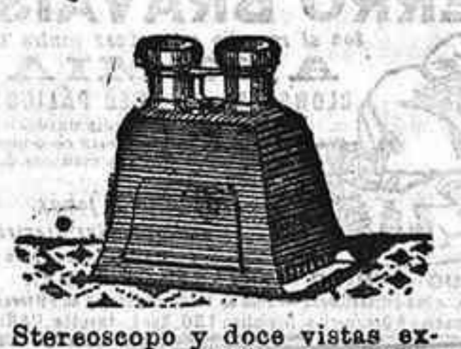
Stereoscopy y doce vistas exposición de 1900. 12'50 Ptas.

PLACAS Y PAPELES DE LUMIERE, GULLENINOT, ST. CLAIR, LISSEGANG, AMERICANAS Y ALEMANAS