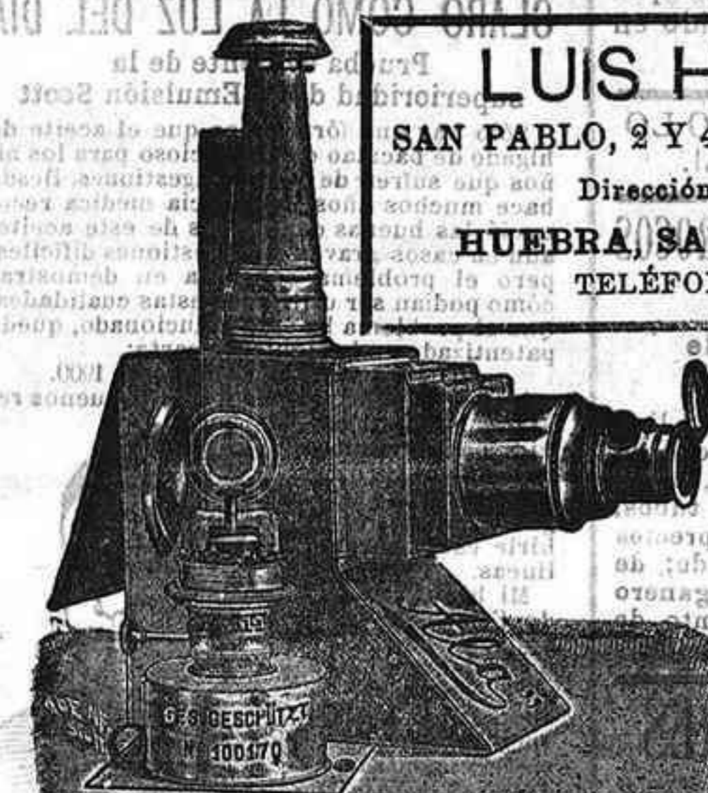
Apuratos de proyección completos, desde 120 ptas.

LUIS HUEBRA SAN PABLO, 2 Y 4 SALAMANCA Dirección telegráfica: HUEBRA, SAN PABLO, 2 Y 4 TELÉFONOS, 88 Y 41