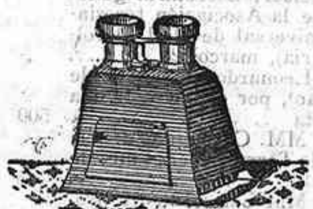
Stereoscopio y doce vistas en posición de 1900, 12'50 PTS.

PLACAS Y PAPELES DE LUMIERE, GUILLEMINOT, ST. CLAIR, LIESEGANG, AMERICANAS Y ALEMANAS