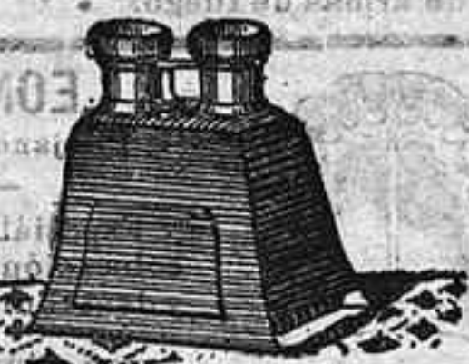
Stenoscopo y doce vistas exposicion de 1900, 12'50 PTS.

PLACAS Y PAPELES DE LUMIERE, GUILLERMINOT, ST. CLAIR, LIESEGANG, AMERICANAS Y ALEMANAS