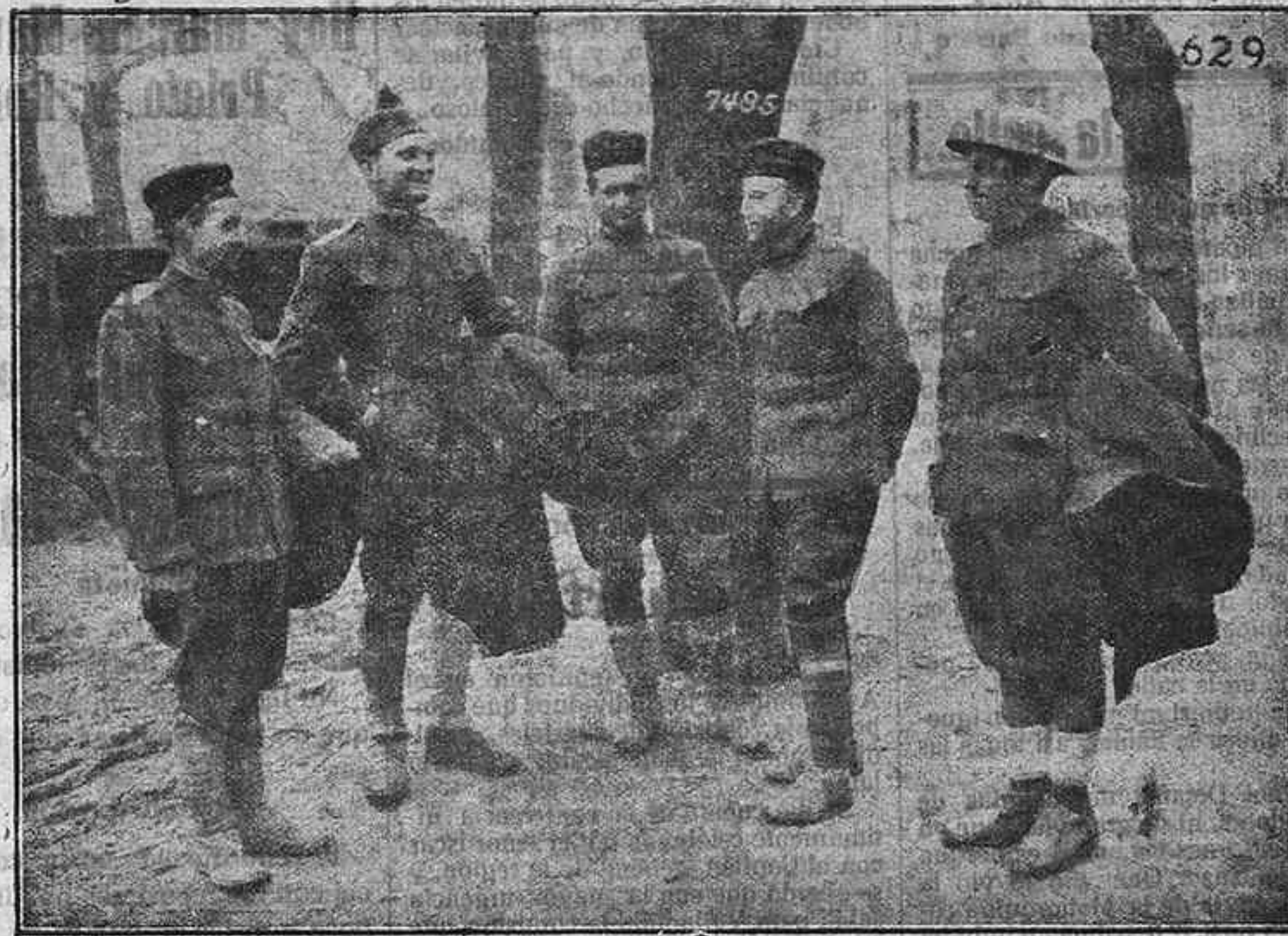
Algunos tipos de prisioneros yanquis cogidos por los alemanes.