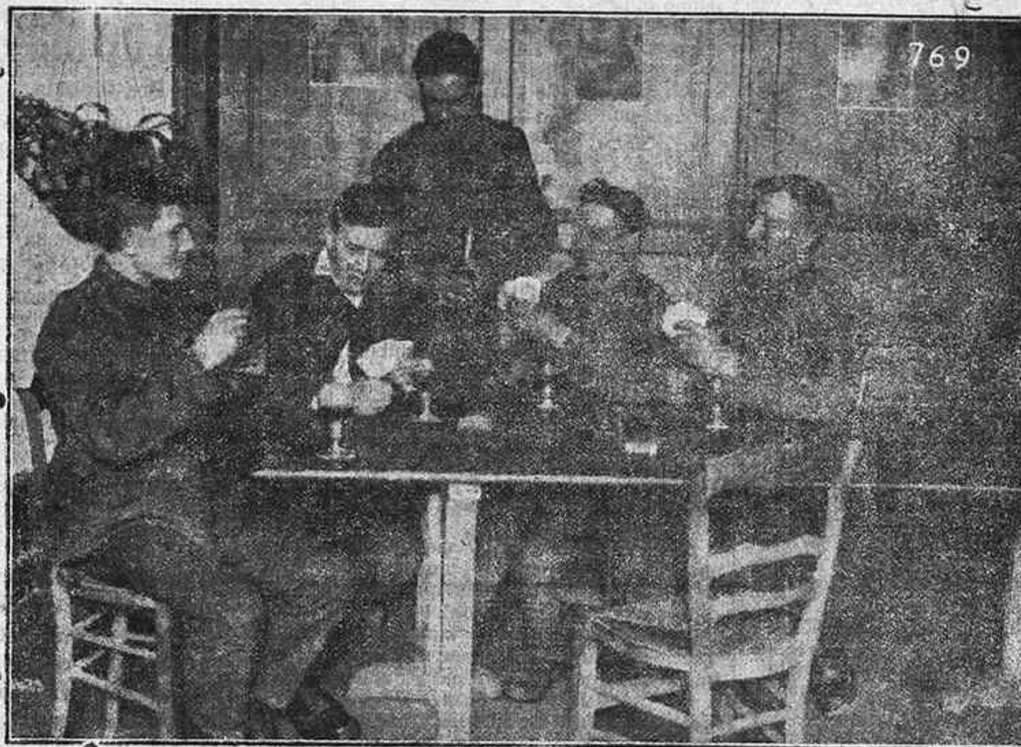
El trato a los prisioneros en Alemania.—Soldados ingleses prisioneros, jugando a las cartas.