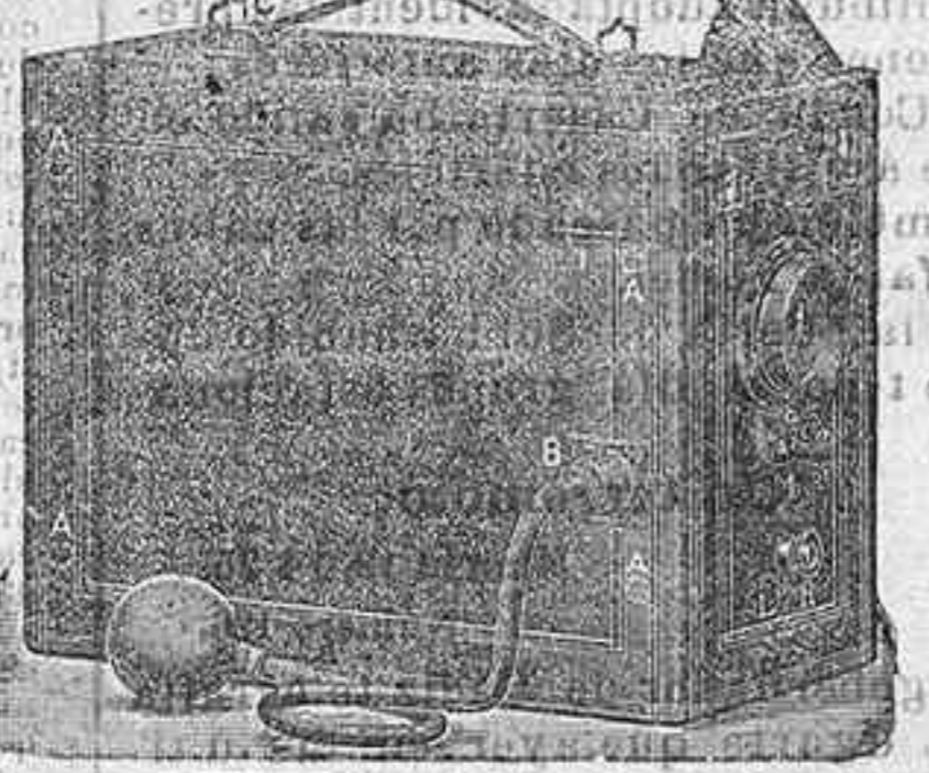
Detective de 6 h por 9 de 6 placas a 9/50

REVELADORES Y FIJADORES Especialidad de la casa KODAKS - Aparatos perfeccionados de películas y placas. Kodak cartucho. Kodak plegante. Bull. Falcón. Le Céniz. Le Bronie