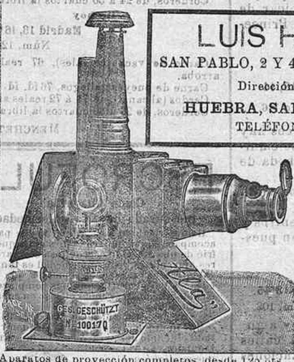
Aparatos de proyección completos, desde 120 pts.