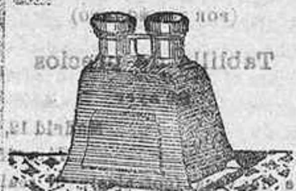
Stereoscopio y doce vistas en posición de 1900, 12/50 PTS.

PLACAS Y PAPELES DE LUMIERE, GUIE, GUERIN, ST. CLAIR, DIEBEGANG, AMERICANA, CANAS Y ALEMANAS