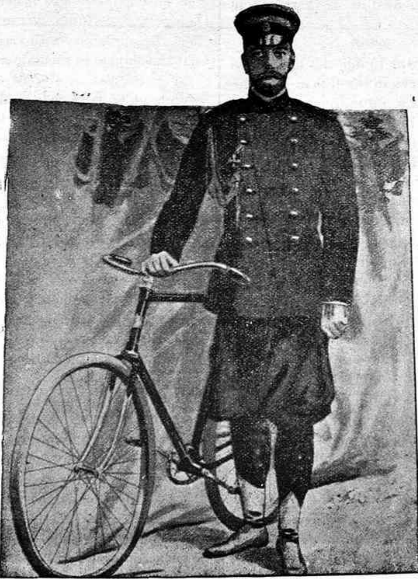
El czar de Rusia.

cido el programa de las enseñanzas del presente curso produjo el anuncio de que ocuparía cátedra el sabio profesor.