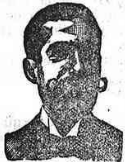
Angelo Costanzi Dip., 845, Barcelona

Preparación la más racional para curar la tuberculosis, catarros crónicos bronquitis infecciones gripales, enfermedades consuntivas, inapetencia, debilidad general, postración, nerviosas neurastenia, impotencia, enfermedades mentales, caries, raquitismo, escrofulismo etc. Frasco 2'50 pesetas. DEPÓSITO: Farmacia del Dr. Benedicto, San Bernardo 41, Madrid y en la provincia Salamanca, de farmacia del Lico. Rodilla. Guijuelo.