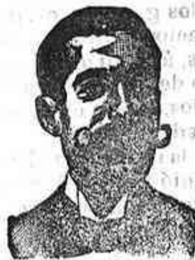
Angelo Costanzi Dip., 345, Barcelona

Preparación la más racional para curar la tuberculosis, catarrros crónicos bronquitis infecciones gripales, enfermedades consuntivas, inapetencia, debilidad general, prostración, nerviosa neurastenia, impotencia, enfermedades mentales, caries, raquitismo, escrofulismo etc. Frasco 2'50 pesetas. DEPÓSITO: Farmacia del Dr. Benedicto, San Bernardo 41, Madrid y en la provincia Salamanca, de farmacia del Lledo, Rodilla, Guijuelo.