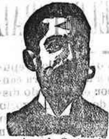
Angelo Costanzi Dip., 345, Barcelona

Preparación la más racional para curar la tuberculosis, catarros crónicos, bronquitis infecciosas, gripales, enfermedades consuntivas, inapetencia, debilidad general, postrección nerviosa, neurastenia, impotencia, enfermedades mentales, caries, raquitismo, escrofulismo etc. Frasco 2'50 pesetas. DEPÓSITO: Farmacia del Dr. Benedicto, San Bernardo, 11, Madrid y en la provincia Salamanca, de farmacia del Lledo. Rodilla. Guijuelo.