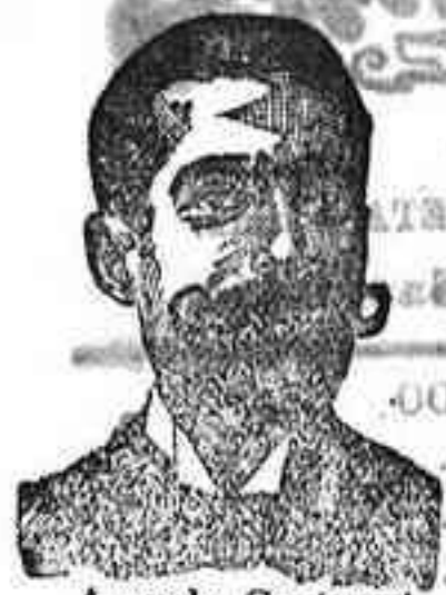
Angelo Costanzi Dip., 345, Barcelona

Preparación la más racional para curar la tuberculosis, catarros crónicos, bronquitis infecciosas, gripales, enfermedades convulsivas, insomnio, debilidad general, postración nerviosa, neurastenia, impotencia, enfermedades mentales, caries, raquitismo, escurfulismo etc. Frasco 2'50 pesetas. DEPÓSITO: Farmacia del Dr. Benedicto, San Bernardo, 11, Madrid, y en la provincia Salamanca, de farmacia del Lledo. Rodilla. Guijuelo.