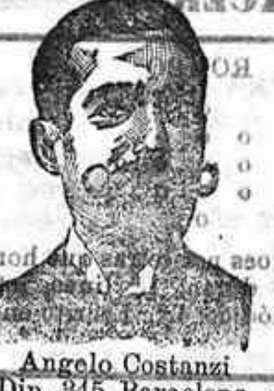
Angelo Costanzi Dip. 345, Barcelona

Preparación la más racional para curar la tuberculosis, catarrros crónicos, bronquitis, infecciones gripales, enfermedad consuntiva, inapetencia, debilidad general, prostración nerviosa, neurastenia, impotencia, enfermedades mentales, caries, raquitismo, escrofulismo, etc. Frasco, 2'50 pesetas. DEPÓSITO: Farmacia del Dr. Benedicto, San Bernardo, 41, Madrid y en la provincia de Salamanca, farmacia del Lledo, Rodilla, Guijue'o.