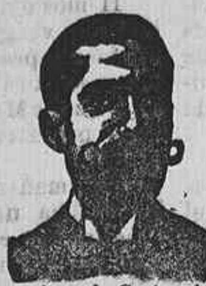
Angelo Costanzi Dip. 435, Barcelona

Especialidad en bombones de chocolate con crema, finísimos caramelos suizos tendat y dulces varios. De venta en todas las confiterías.—Depósito central MONTERA, 25.—MADRID.