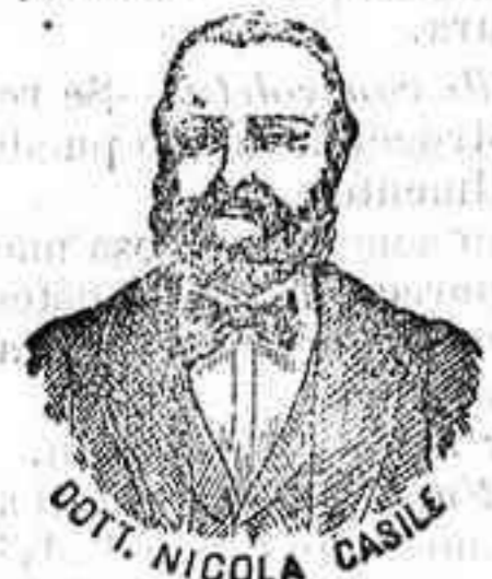
DR. NICOLA CASILE

han logrado que el Dr. Casile, de Nápoles, descubriera los milagrosos medicamentos que curan infaliblemente la tisis en cualquiera de sus períodos y todas las enfermedades del estómago. A la más pequeña manifestación de un resfriado, tos, catarro, bronquitis, gripe, asma (asfoación), expectoración y de cualquier enfermedad del pecho, tomar inmediatamente las Perlas Casile, que no sólo curan infaliblemente estas enfermedades, sino que se tendrá la completa seguridad de no contraer otras mucho más graves. Siguiendo este método se podrá decir no más tisis. Si por desgracia no se hubiera seguido este tratamiento y por desgracia cualquier persona se encontrara atacada de tisis, o si no se curara porque gracias a los venenantes e tóxicos no se pudo encontrar los renombrados Confitos Casile que asociada a las Perlas combaten con eficacia la tisis en cualquiera de sus períodos.