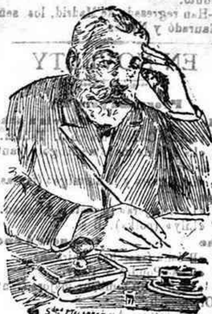
Mr. Guyot-Dessaigues, ministro francés que hace pocos días falleció en la Cámara de Diputados de Francia.