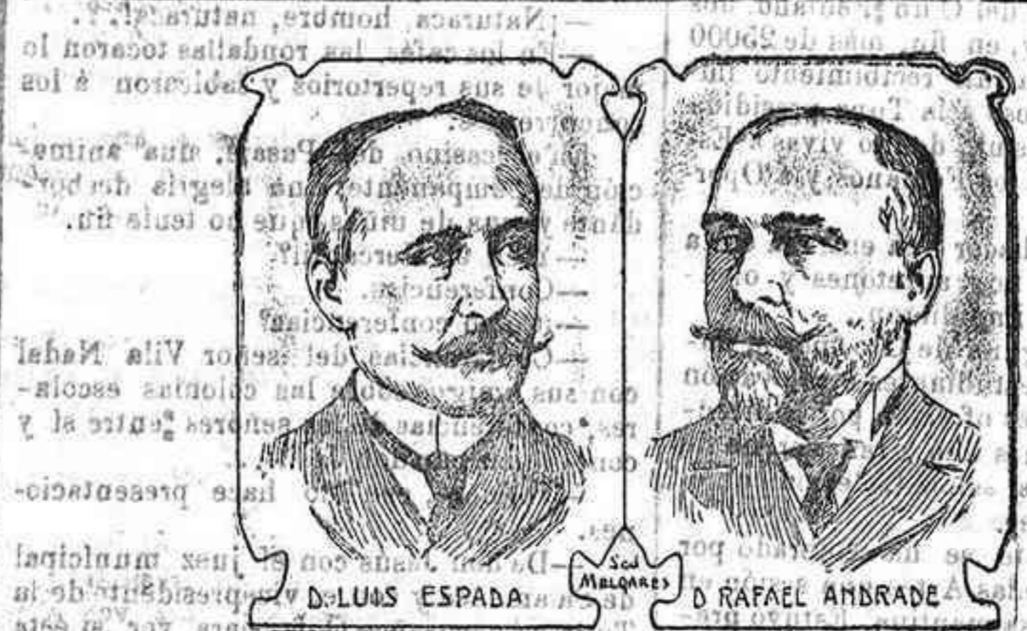
Nuevos Subsecretario del ministerio de Hacienda y Director de Obras Publicas respectivamente