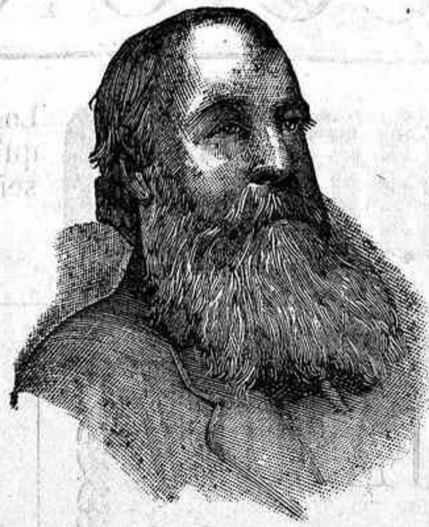
MR. JAMES PRESCOTT JOULE