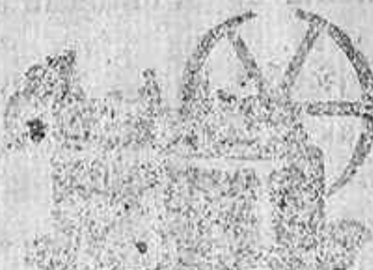
Máquina de vapor