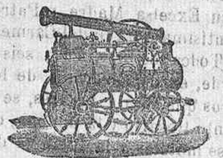
Máquina de vapor locomovil

Catálogos gratis y francos á quien los pida