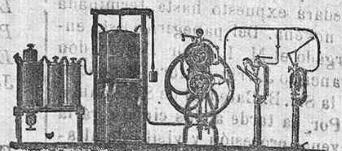
Aparato para gaseosas continuo, con embotelladura unidos