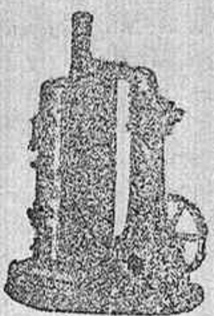
MAQUINA DE VAPOR VERTICAL.

SUCURSAL EN VALLADOLID Acera de Recoletos, número 6