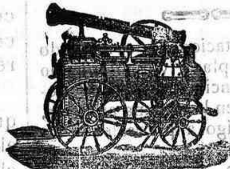
Máquina de vapor locomovil.