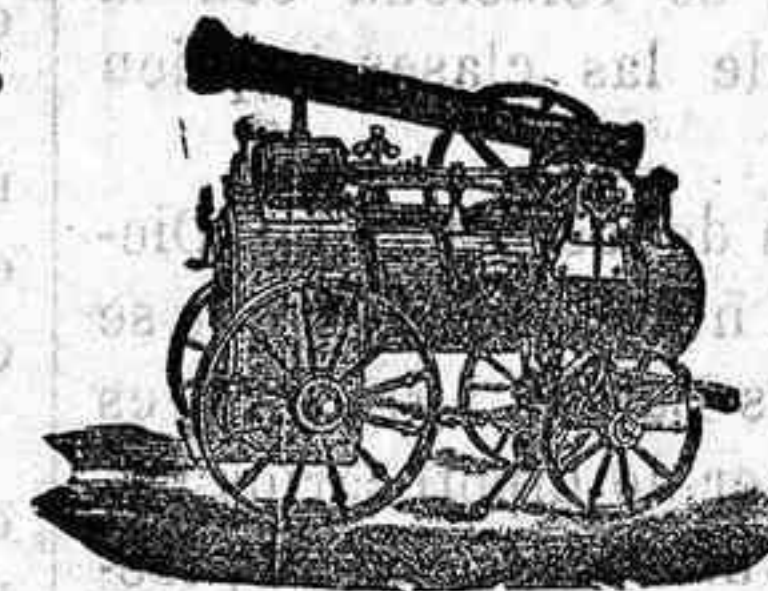
Máquina de vapor locomóvil

Máquinas de vapor, Bombas, Pesas, Tubos de todas clases, aparatos para hacer gaseosas y toda clase de maquinaria.