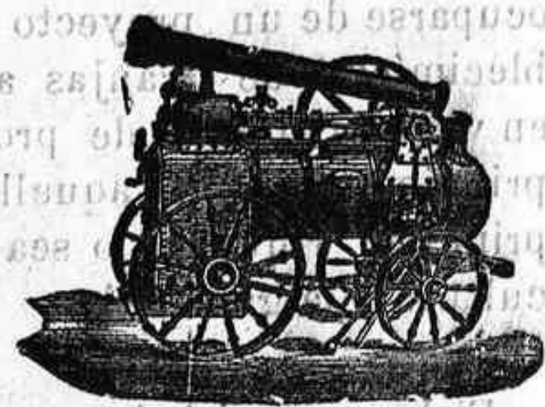
Maquina de vapor locom6vil

Cat6logos gratis y francos á quien los pida