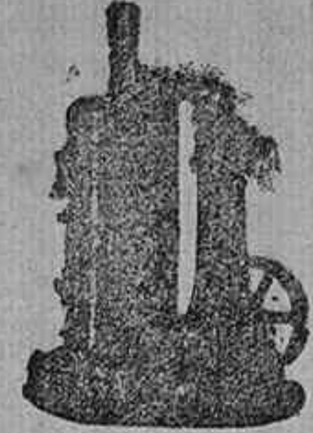
MAQUINA DE VAPOR VERTICAL.

Catálogos gratis y franco. á quien los pida.