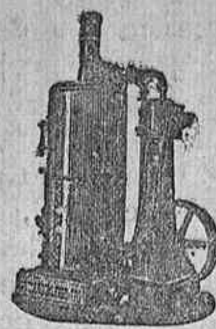
MADUINA DE VAPOR VERTICAL.

Catálogos gratis y franco á quien los pida.