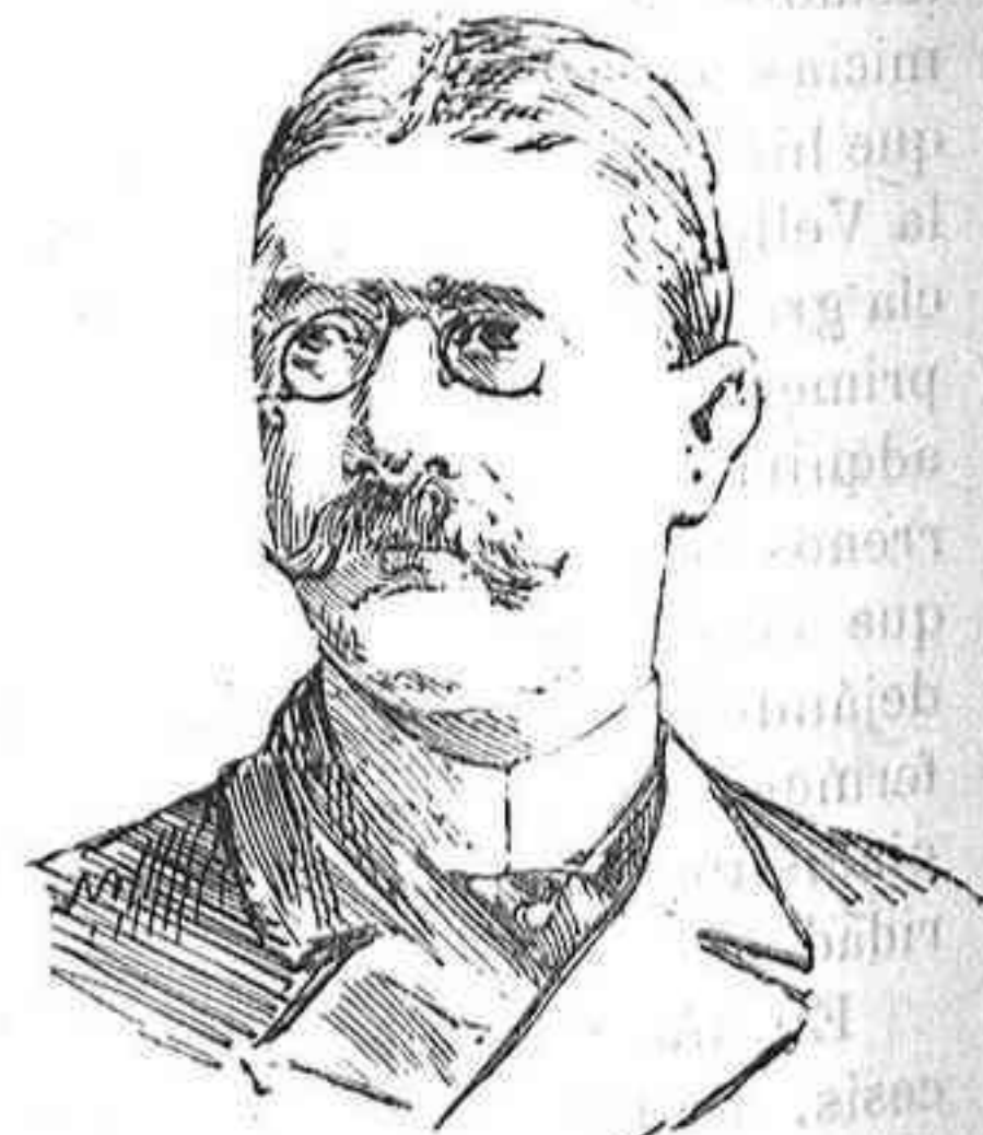
BARÓN DE GAUSTSCH, Presidente del Consejo de Ministros