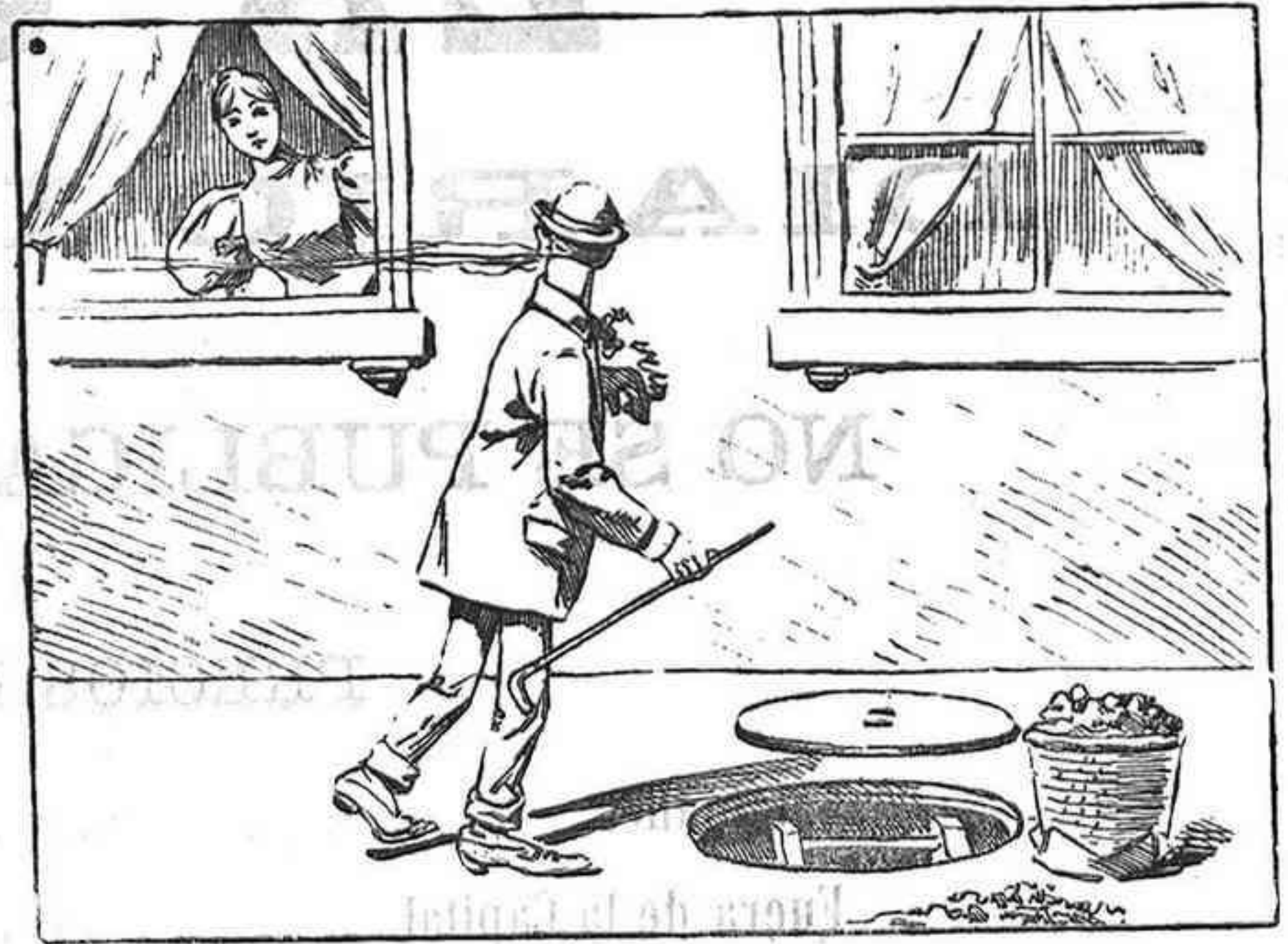
—Yo te amaría.