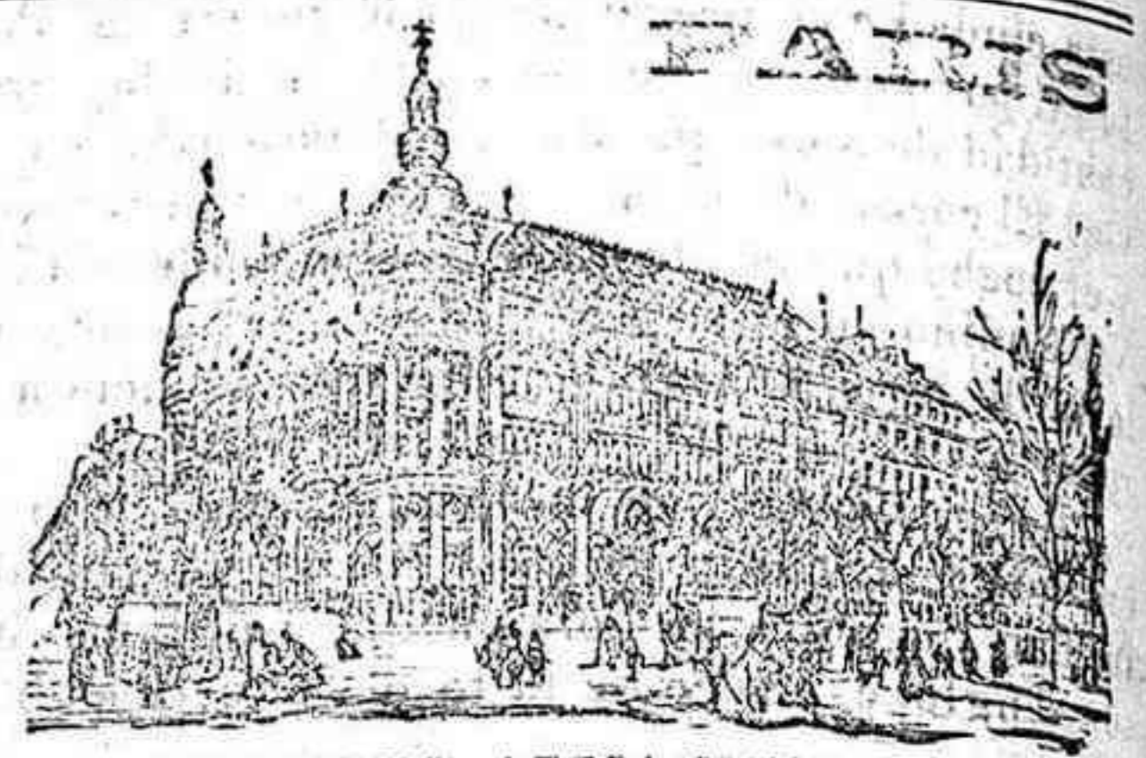
GRANDES ALMACENES DEL

Calle de la Rúa, número 13.—Junto á la Ciudad Condal.—Salamanca.