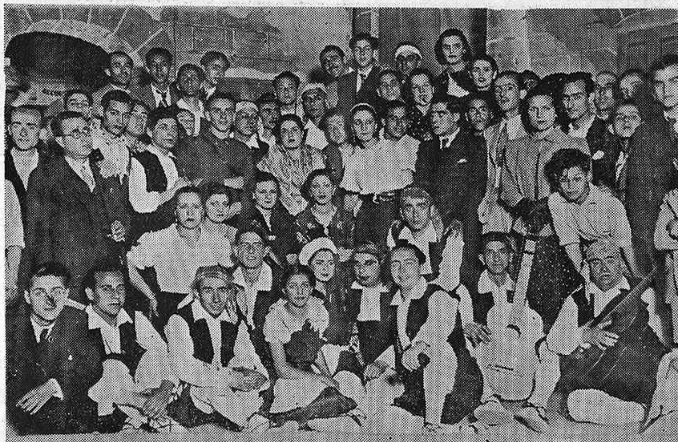
El cuadro artístico de E. A. J. 24, que interpretó con gran acierto «La casa de Quirós» y «Los de Aragón», en el festival celebrado el día 5 del actual, a beneficio de la Caja de Socorros Mútuos de la Banda Municipal.