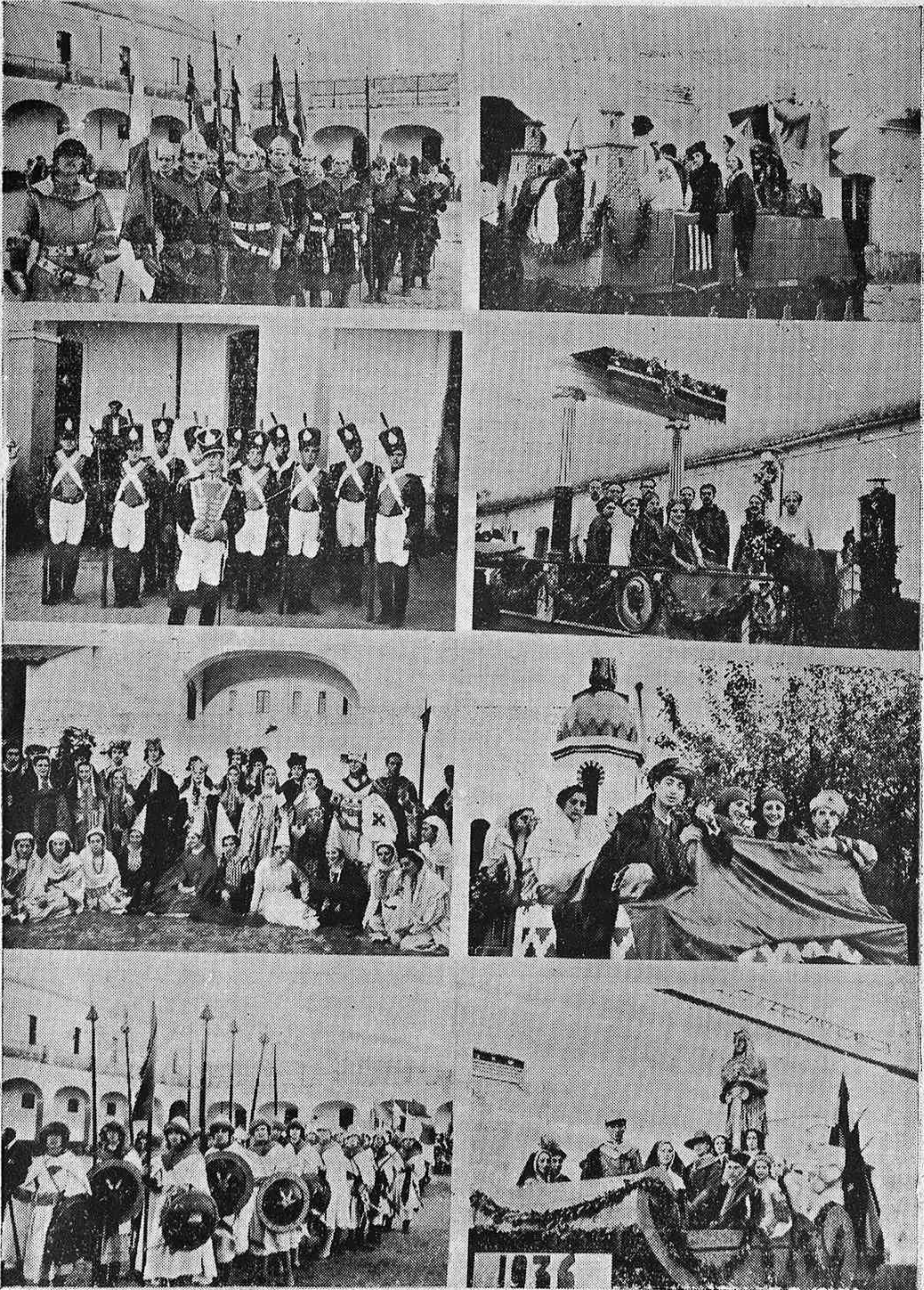
Personajes y carrozas que figuraron en la Cabalgata conmemorativa del Centenario de la Reconquista.

TINTO ANDALUZ es un vino de perfume delicado y paladar suave. Bébalo en todas las comidas.