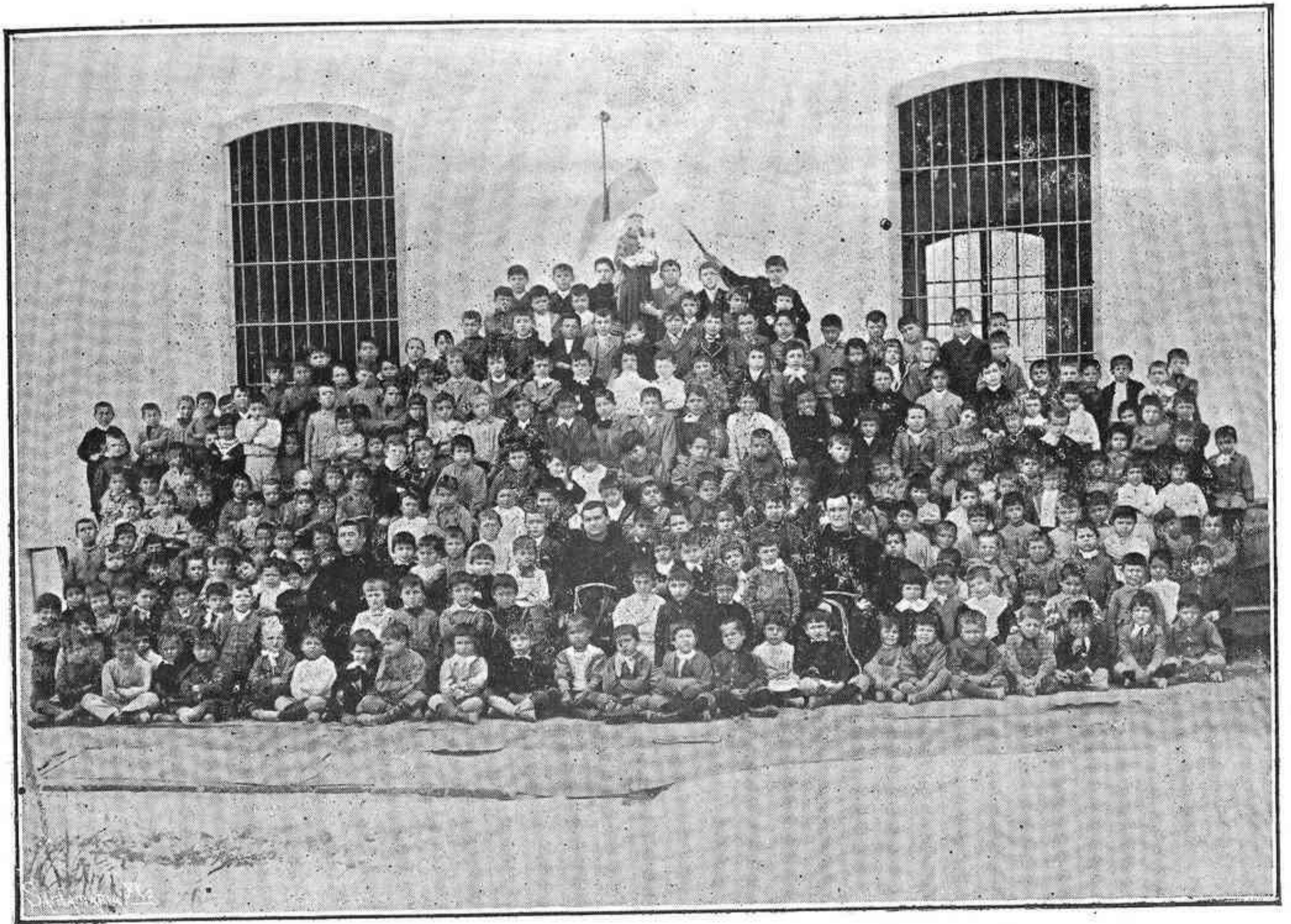
Escuelas Franciscanas.---Grupo de profesores y alumnos.

notas gráficas de las instituciones de enseñanza y beneficencia y de los centros industriales de nuestra ciudad.