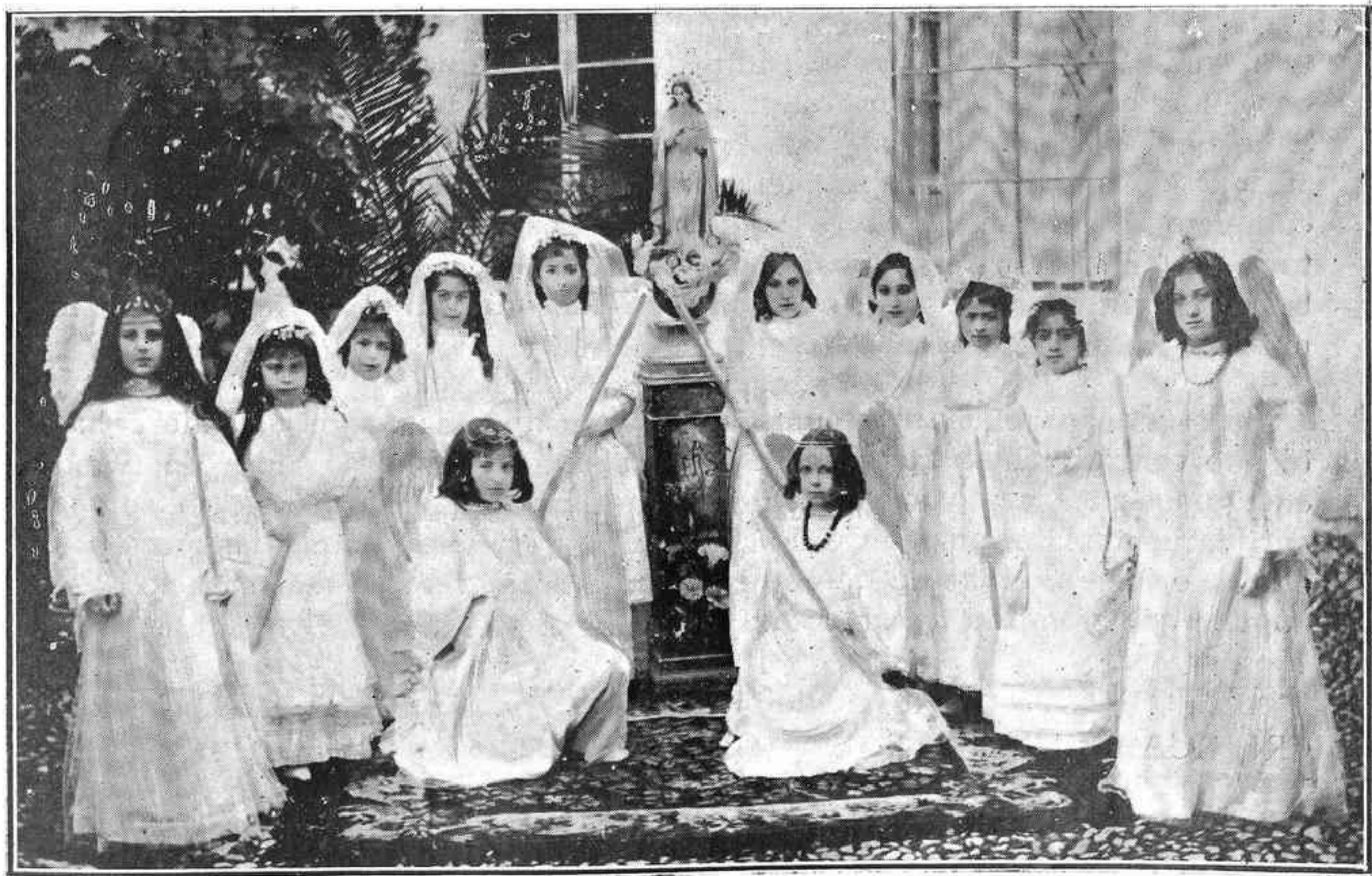
Niñas vestidas de ángeles que en la procesión de Nuestra Patrona precedían á la Sagrada Imagen

La entrada de la Virgen Santísima después de la procesión, que constituye el coronamiento de todas las fiestas, es un espectáculo siempre antiguo y siempre nuevo, y el que una vez lo presencia guarda en su memoria un re-