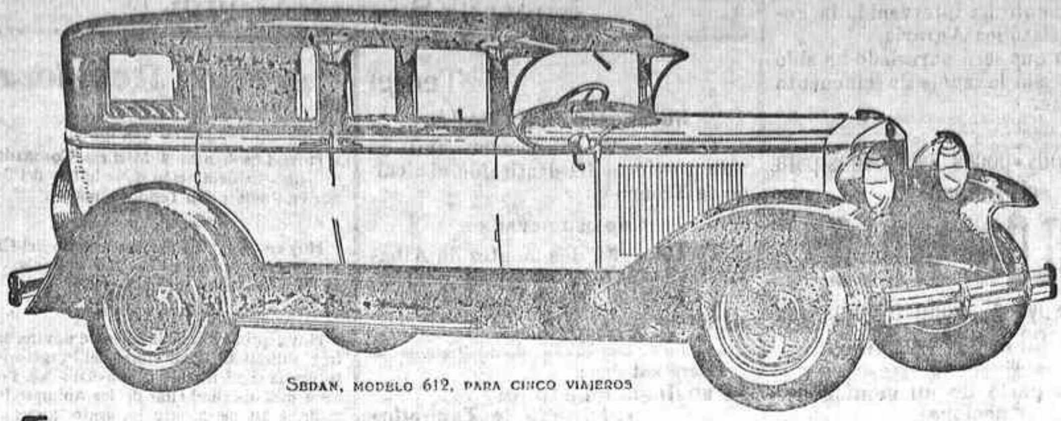
SEDAN, MODELO 612, PARA CINCO VIAJEROS