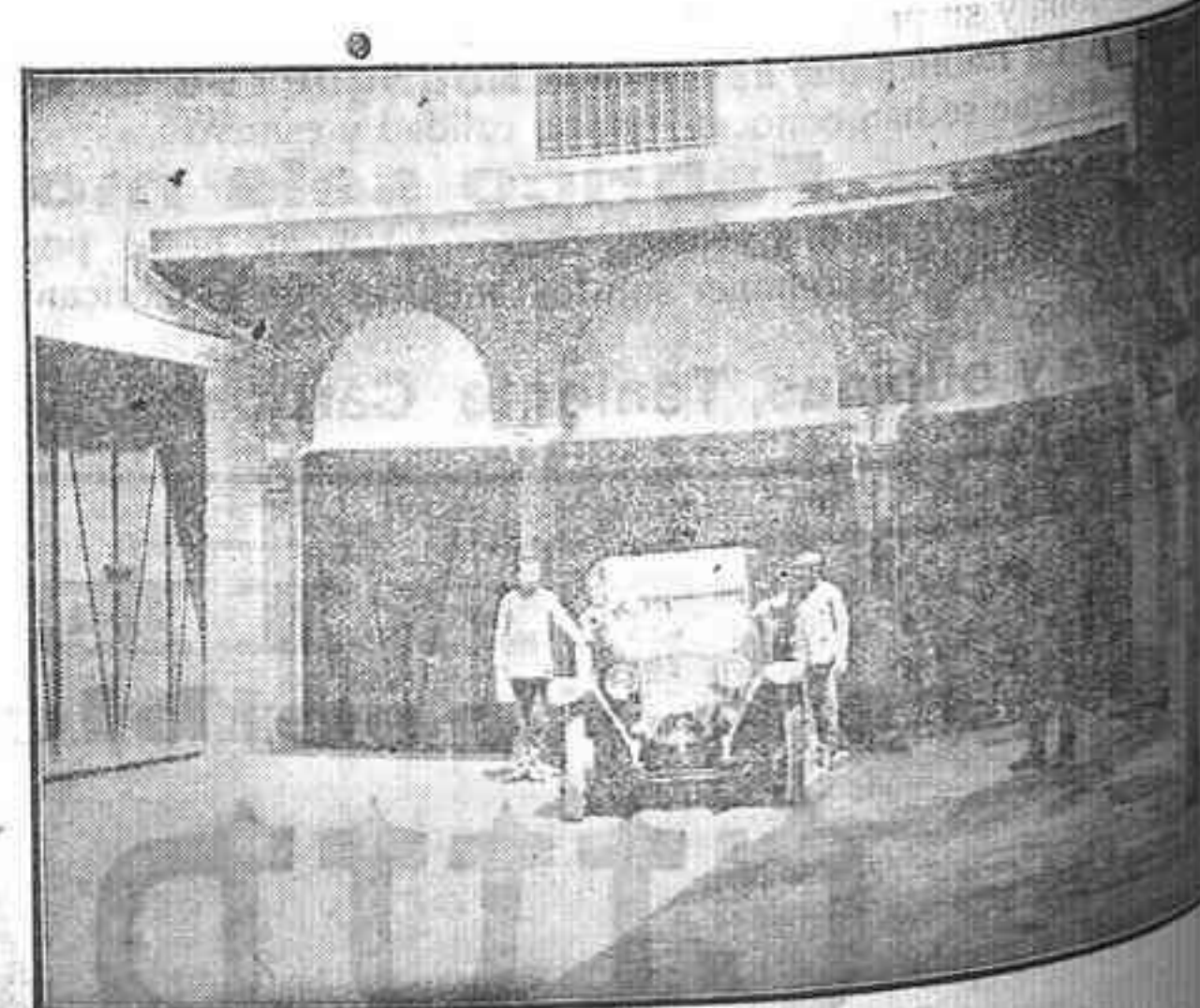
Cocheras del patio interior

En este mismo Garage se arriendan locales para Exposición de Industrias