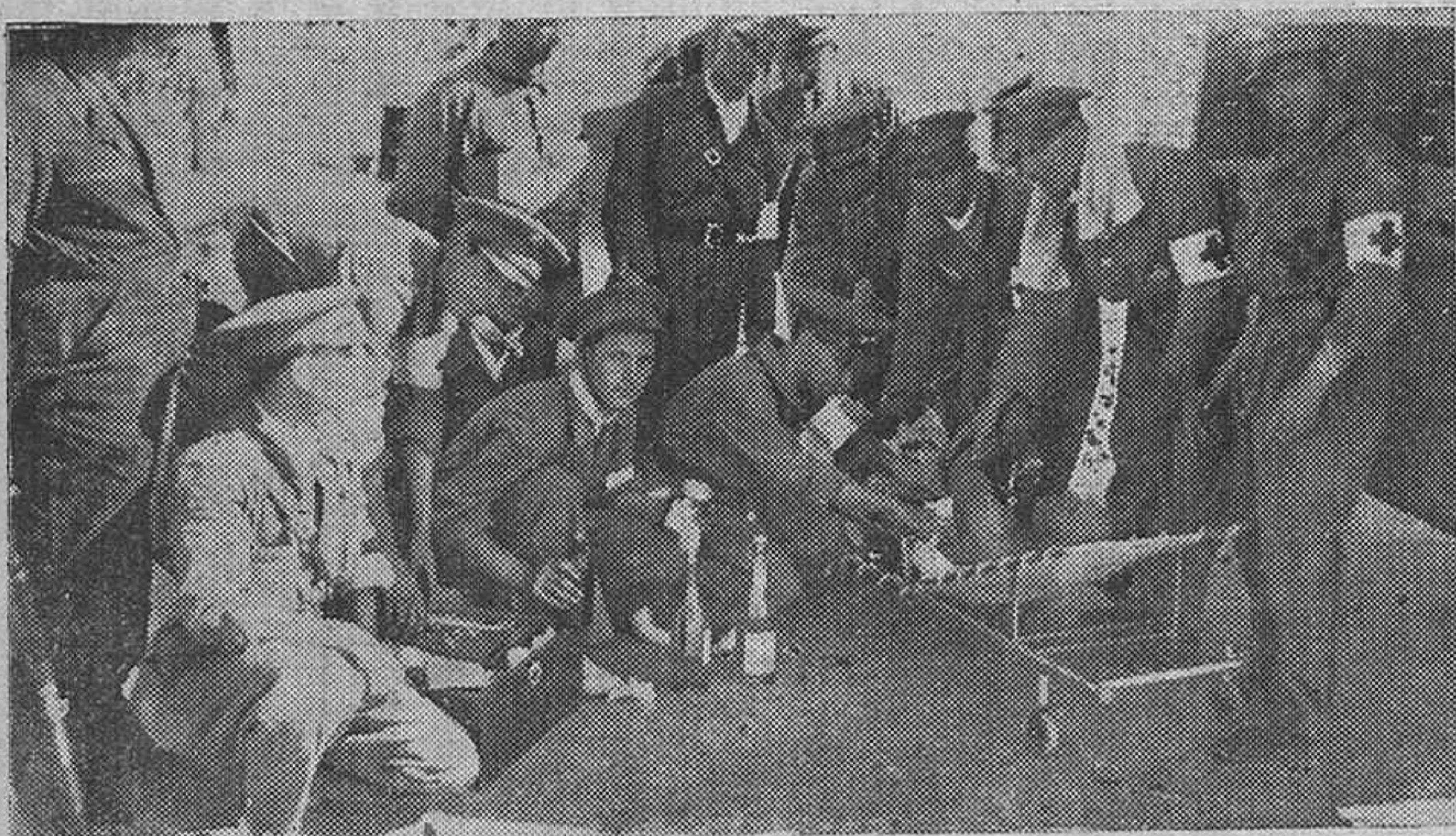
Una ambulancia sanitaria en las proximidades de Villafranca, presta la cura de urgencia a un herido. Los sanitarios están realizando una labor patriótica digna de todo elogio y admiración, por su abnegación, valor, y sacrificio.