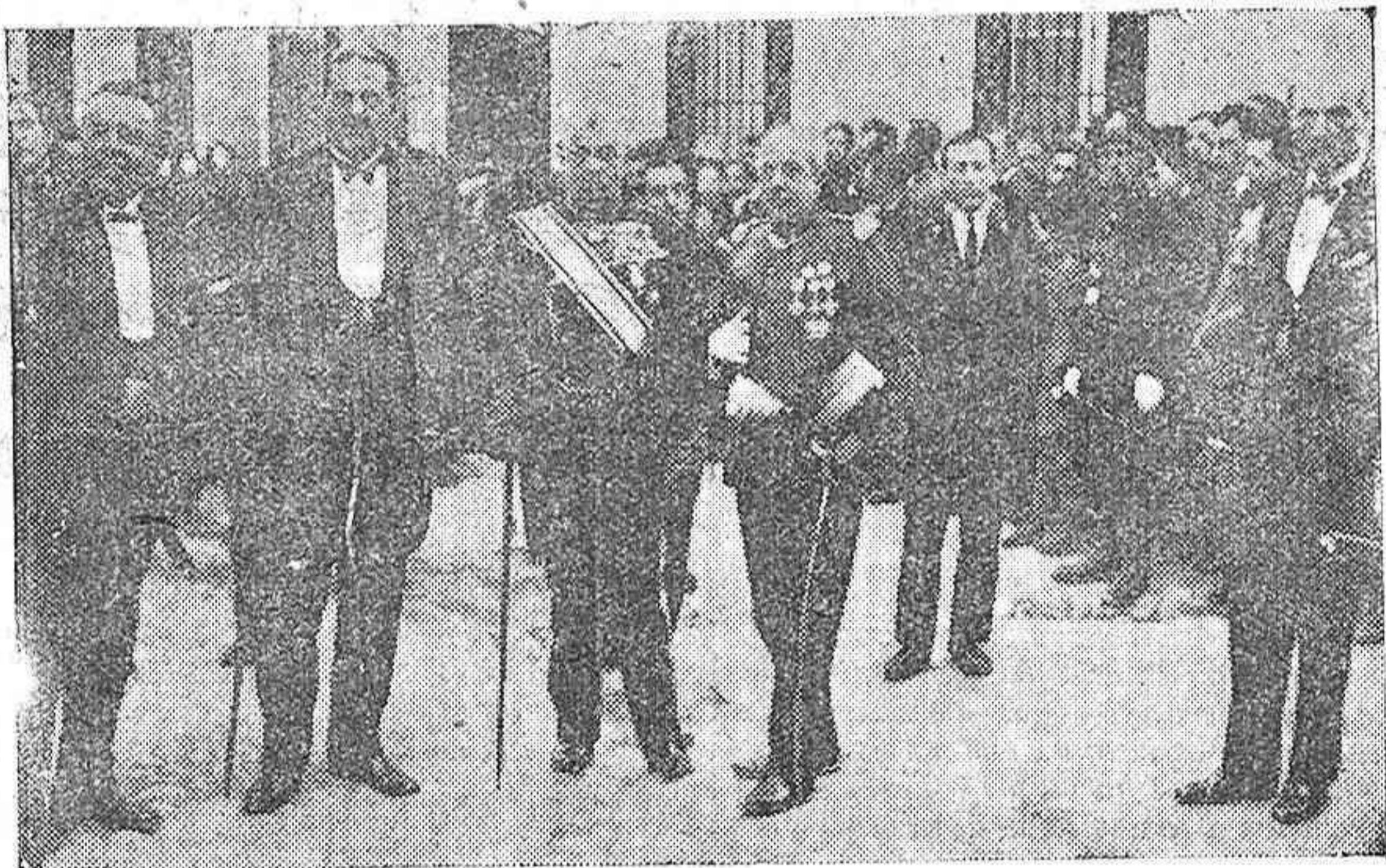
PRESIDENCIA DEL SANTO ENTIERRO, CONSTITUIDA POR LAS AUTORIDADES.