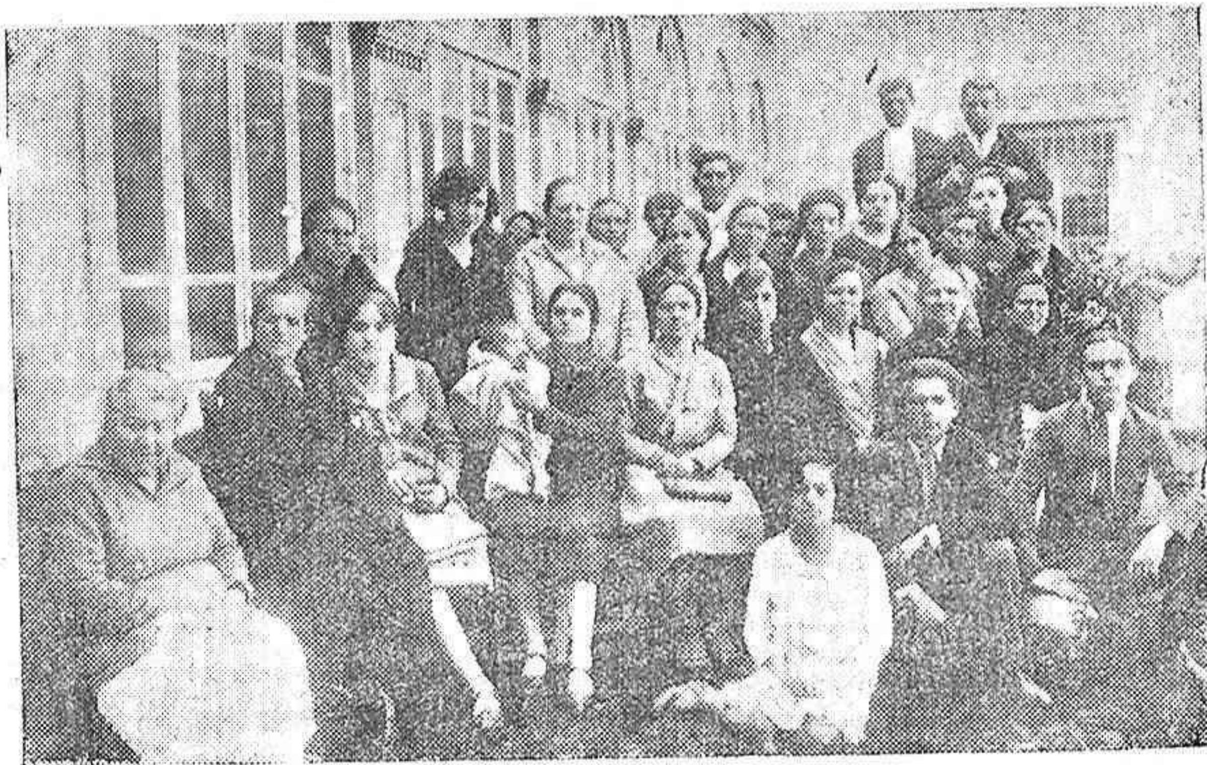
EL CONCURSO DE SAETAS ORGANIZADO POR EL AYUNTAMIENTO.—GRUPO DE «CANTAORES» QUE OBTUVIERON PREMIO Y QUE ADEMÁS CANTARON SAETAS AL PASO DE LAS COFRADIAS.

Ha trasladado su clínica dental a la calle Braulio Laportilla, número 6 principal, esquina a Góngora.