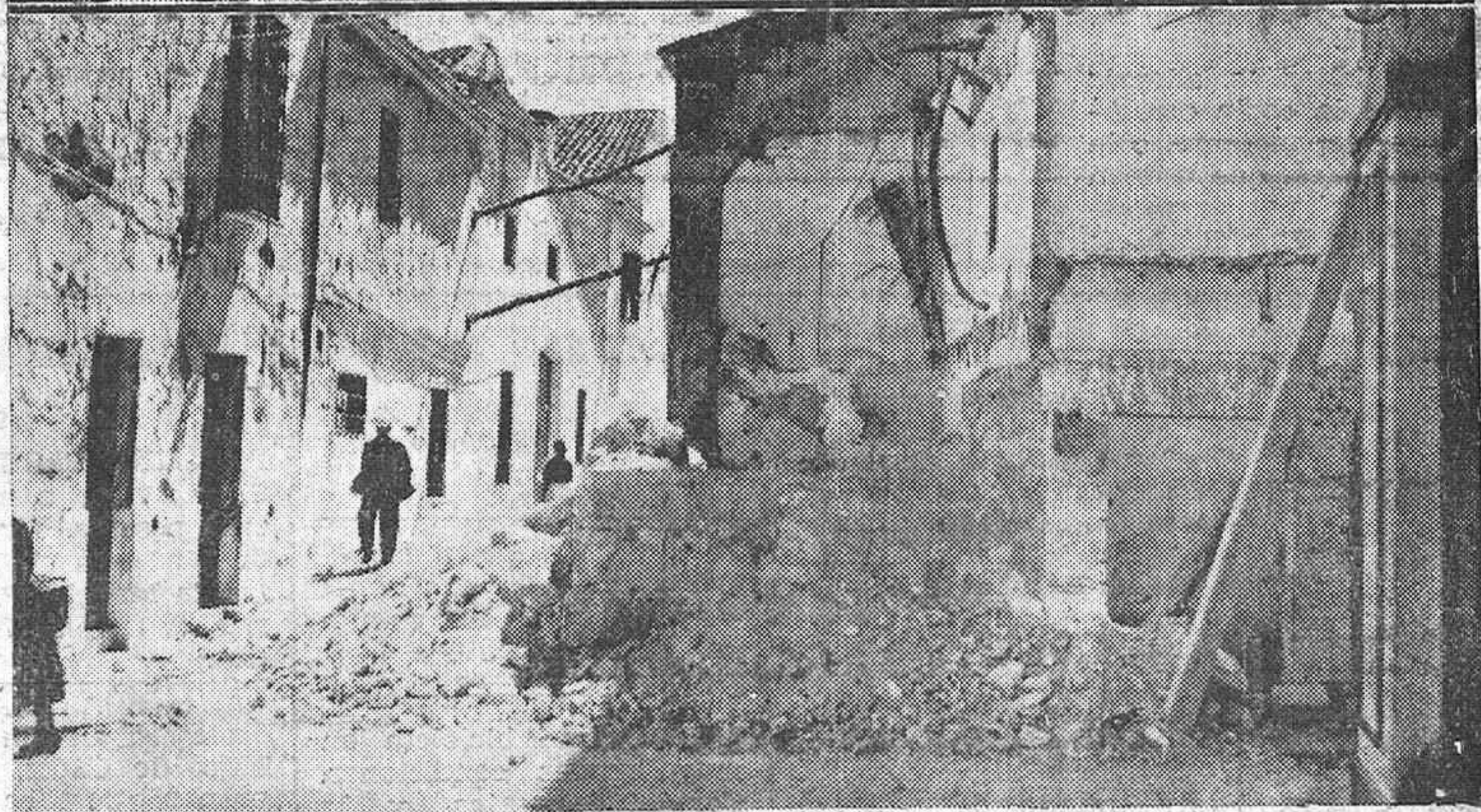
ARRIBA: Entrega de la Gran Copa del Campeonato de Primera Categoría de equipos no federados a "Córdoba F. C.", en el Stadium América.—ABAJO: Derrumbamiento de parte del Convento de Santa Ana, en Montilla. (Fotos Santos).