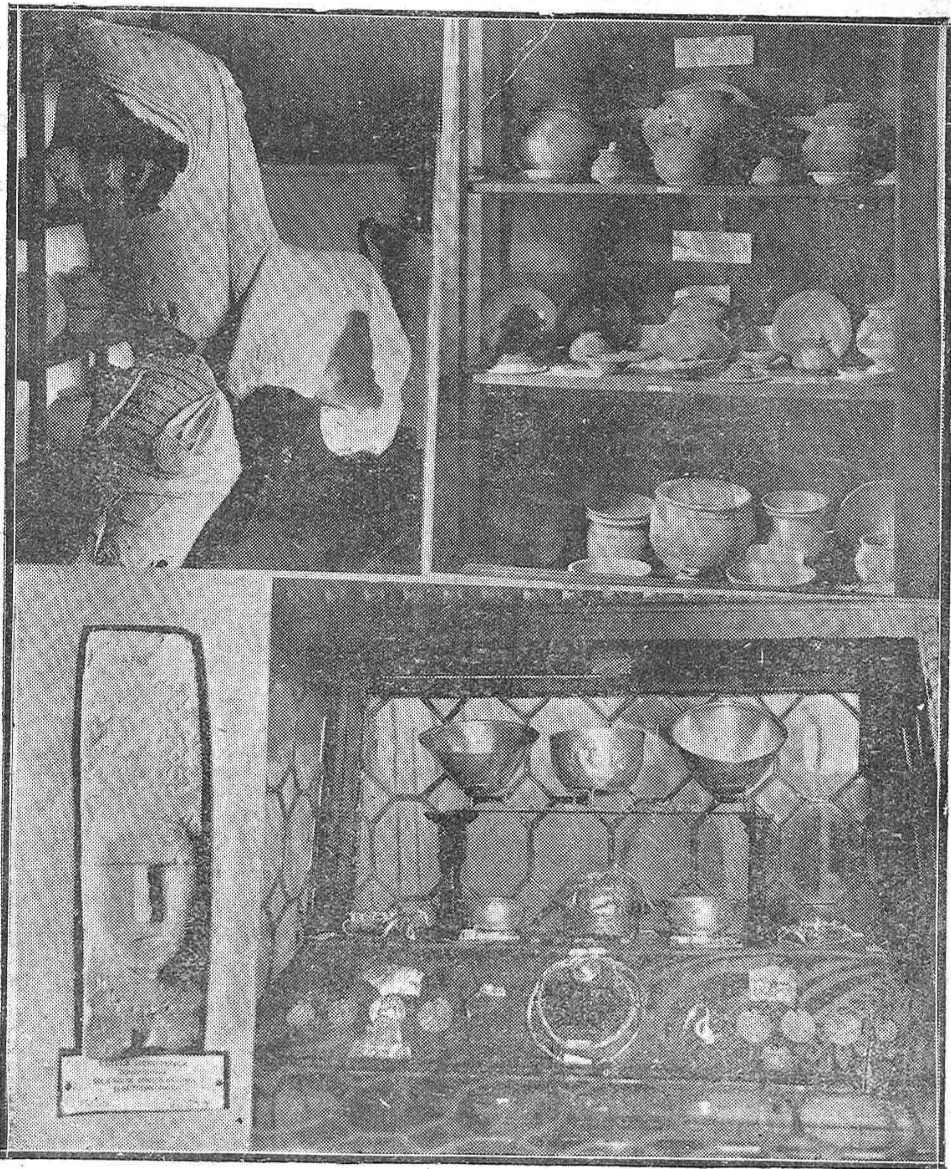
Interesantes objetos que, para la Exposición de Barcelona, envía el Museo Arqueológico Provincial.—Vitrina ibérica de cerámica.—León ibérico, en piedra.—Magnífica estela, que es un monolito ibero-púnico.—Vitrina de orfebrería ibérica.