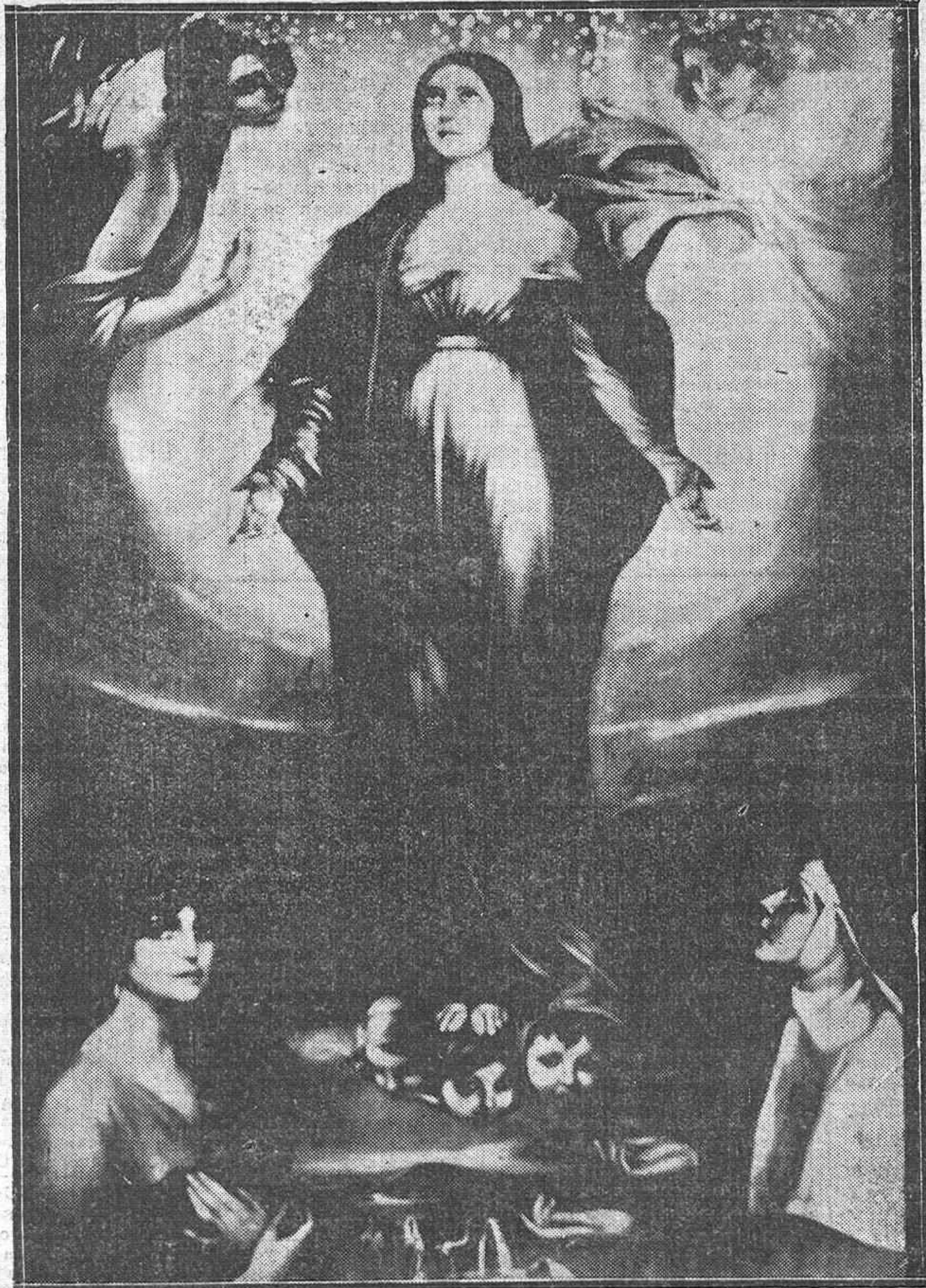
UNA BELLISIMA OBRA DE ARTE. — Magnífico cuadro de la Virgen de los Faroles, debido al genial pincel de Romero de Torres. Esta noche se inaugurará y bendecirá con inusitada solemnidad