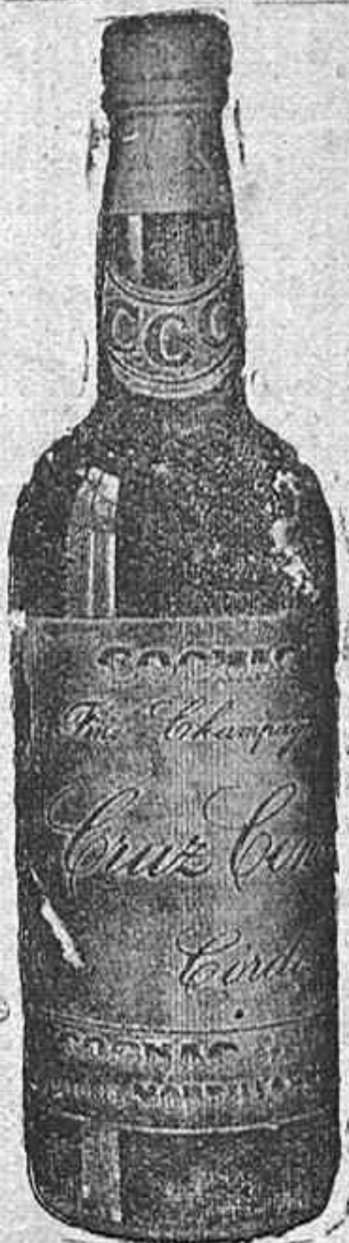
Cofiac Cruz Conde

Gabanes y tragecitos para niño en El Metro y sus tres Sucursales, infinidad de modelos a precios convenientes.