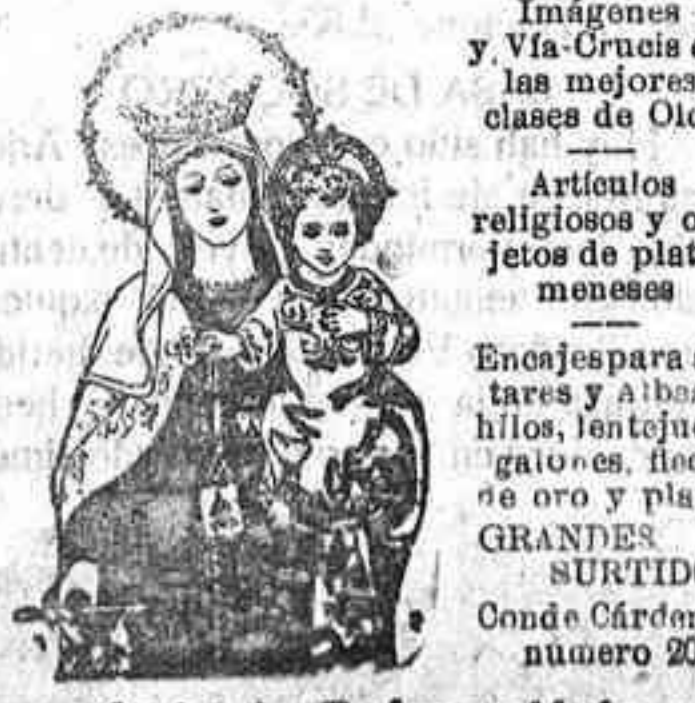
Antonio Zaf a y Vela

En el templo de las Religiosas Escavas, puede visitarse diariamente al Santísimo.