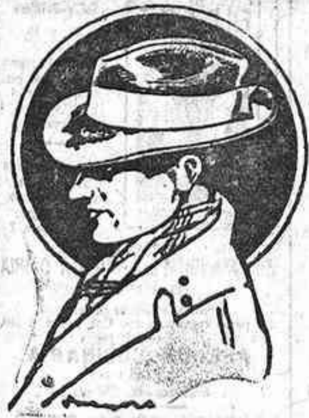
La célebre gorra DIEGO RUIZ, de nueva creación. En ferros extenso surtido en dibujos exclusivos.