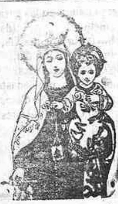
Antorcha y vela

GRANDES SUERTIDOS Conde Cárdenas número 20