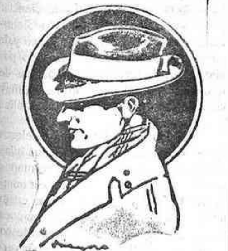
La gorra LEGO RUIZ es la marca de L... adoptada por todos los Elegantes. SOMBRERÍA DE MODA — CALLE DE MARIA CRISTINA —