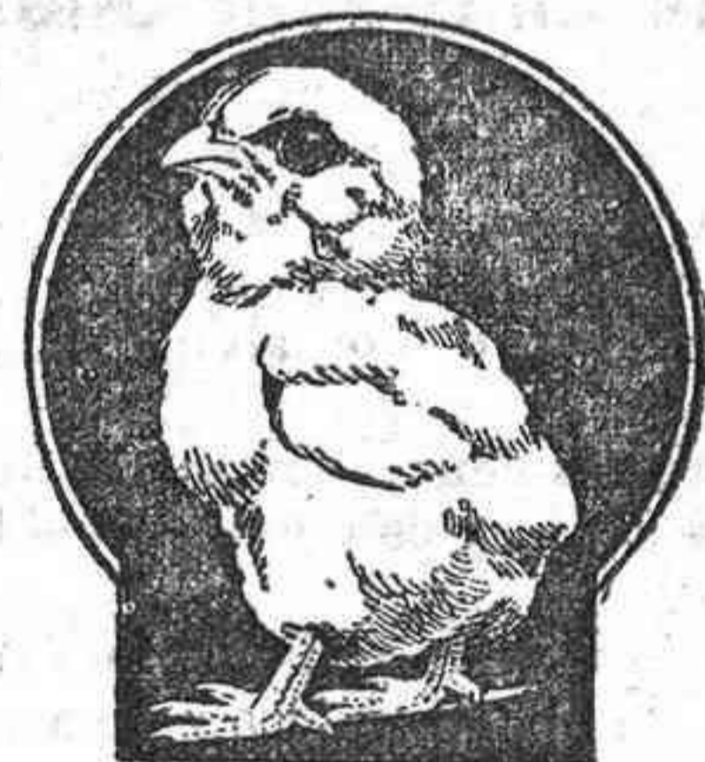
Polluelos de razas puras GRANJA PARAÍSO Arenys de Mar (Barcelona)