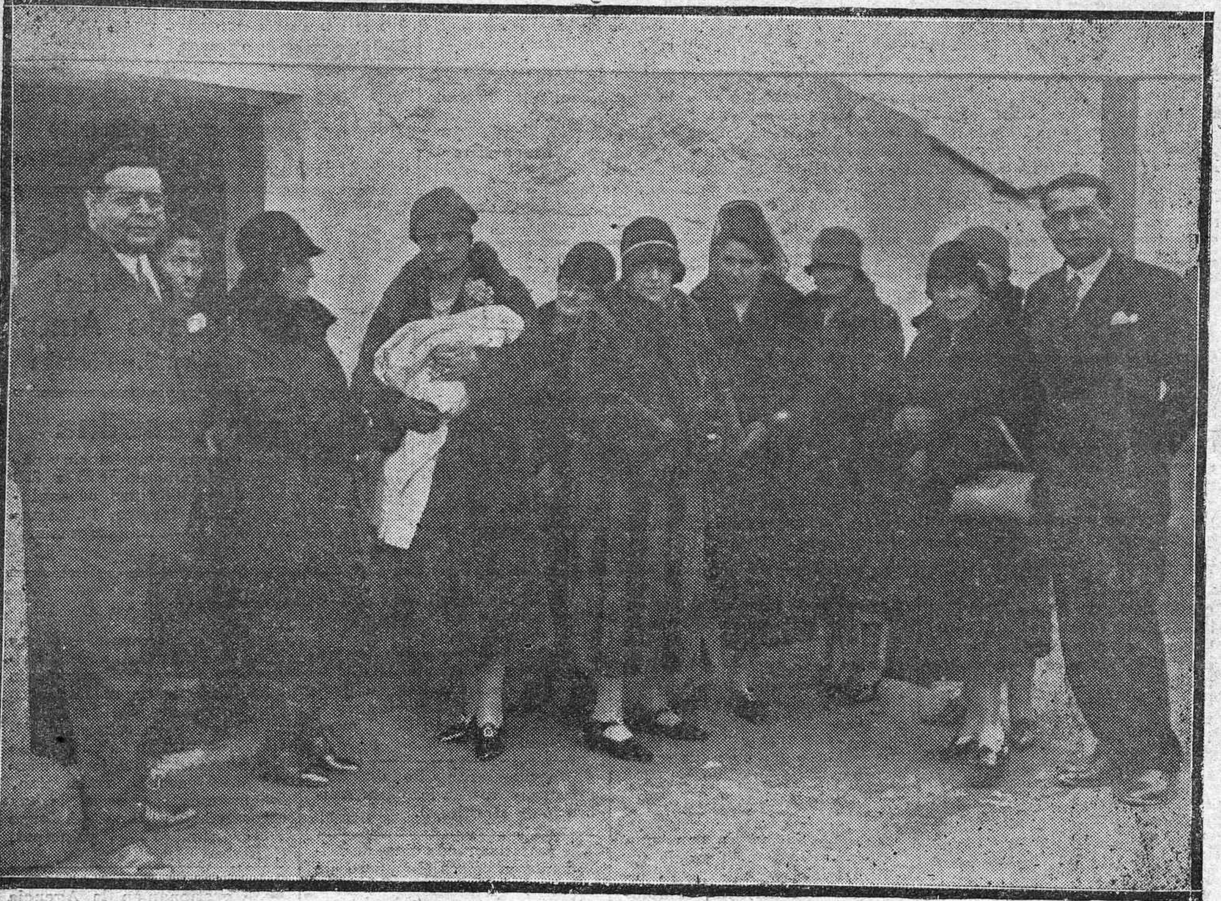
Damas organizadoras del Consultorio Médico, después de la aplicación a un niño de la vacuna antituberculosa ensayada por vez primera en Córdoba,