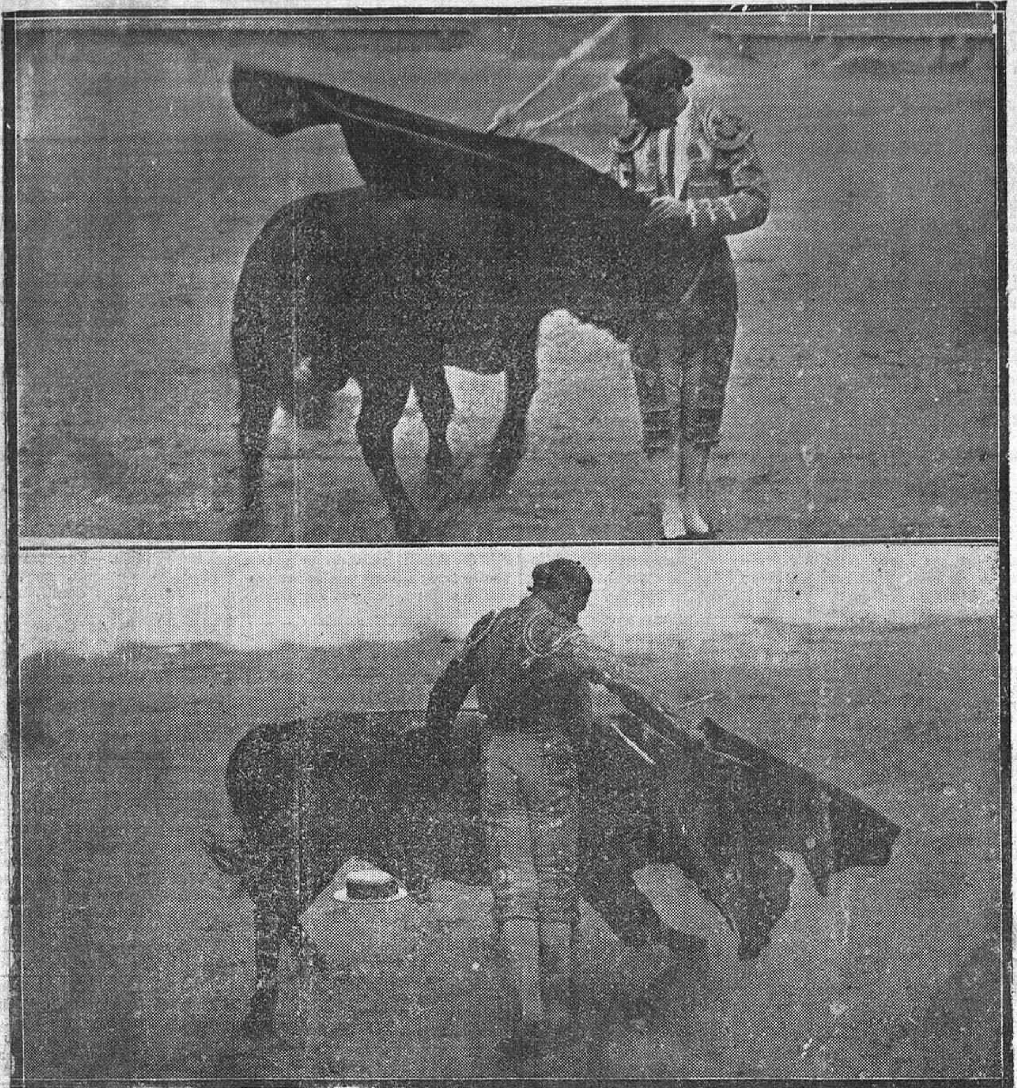
LA SEGUNDA CORRIDA DE FERIA.—VICENTE BARRERA ADORNÁNDOSE CON LA MULETA EN SU ÚLTIMO TORO. EL GRAN MULETERO, EN OTRO MOMENTO CUMBRE DE LA FAENA QUE REALIZÓ AL SEXTO DE LA LIDIA ORDENARIA