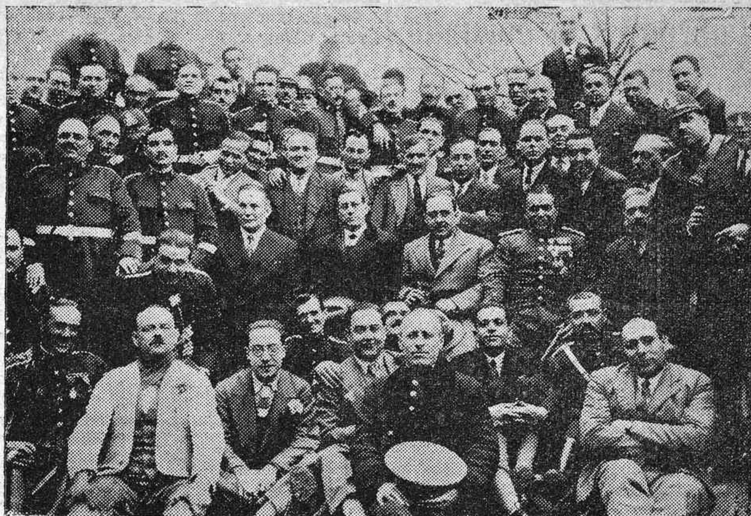
EL GOBERNADOR CIVIL, SR. ATIENZA, CON LOS CUERPOS DE VIGILANCIA Y SEGURIDAD, EN LA FIESTA DEL PATRÓN DE DICHS CUERPOS.

ESPLENDIDO es el gran surtido de cortes de traje listas moda, para caballero, recibido en EL METRO y sus tres Sucursales.