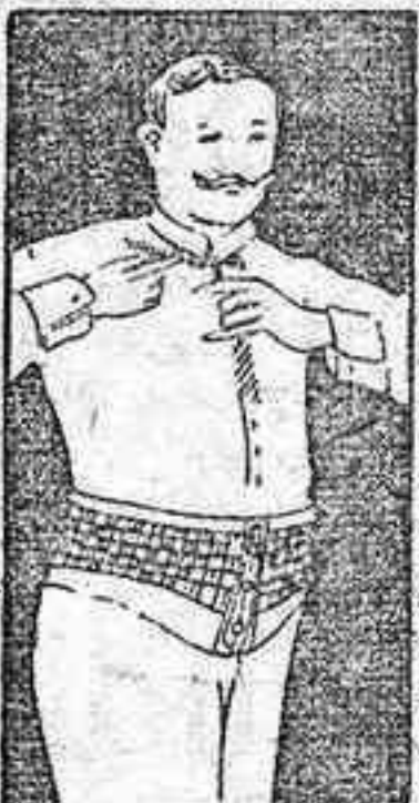
FAJA DE CABALLERO