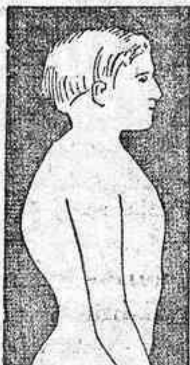
MAL DE POTT